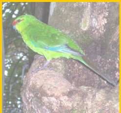
La perruche front rouge